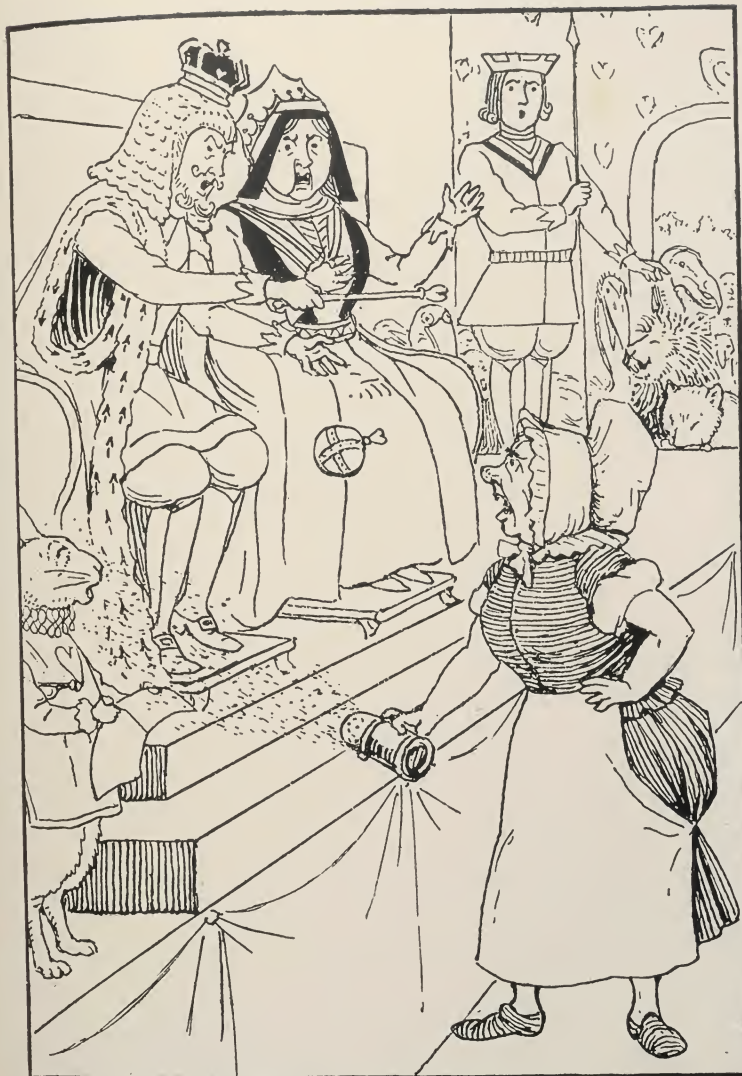
LA KUIRISTINO RIFUZAS ATESTI.

Do, faldinte la brakojn kaj sulkiginte la